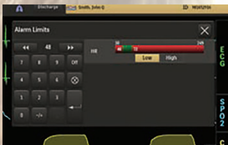
Работа с сигналами тревоги

Решение Expression IPS предоставляет гибкие возможности для составления отчетов и анализа трендов. Можно отобразить стрелки, указывающие направление изменения основных физиологических показателей пациента, настроить отображение трендов на дисплее и легко получить доступ к данным трендов пациента.