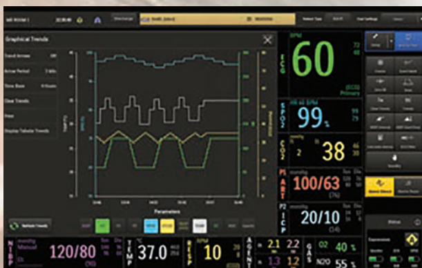
Различные возможности работы с трендами

Функции ведения документации обеспечивают быстрый и удобный доступ к процессам медицинского обслуживания пациентов, включая ускорение процессов приема и выписки с использованием беспроводного сканера, и позволяют легко связать его с информационной системой больницы, повышая эффективность работы. Также можно получить стоп-кадр ЭКГ-записи и пометить какое-либо событие для печати аннотаций.